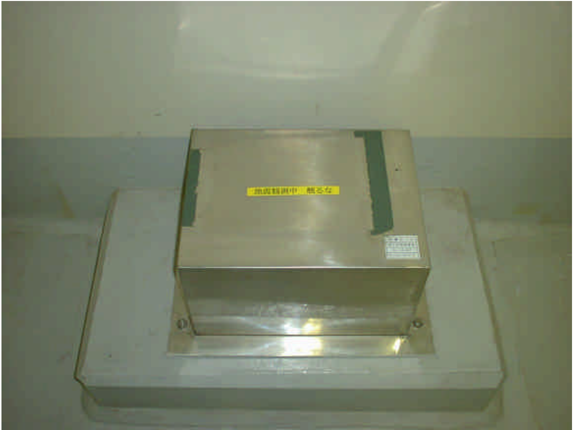
観測用地震計（検出部）