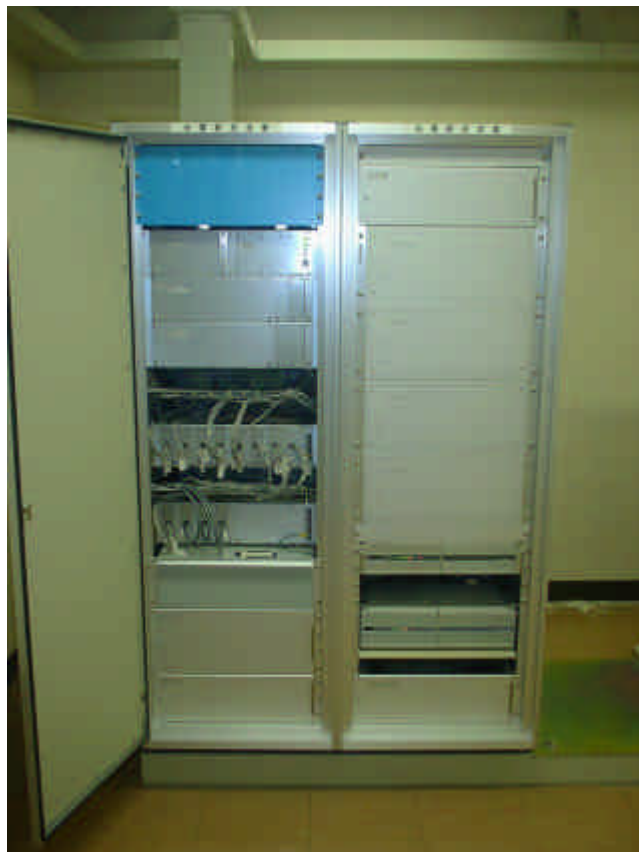
観測用地震計（測定部）