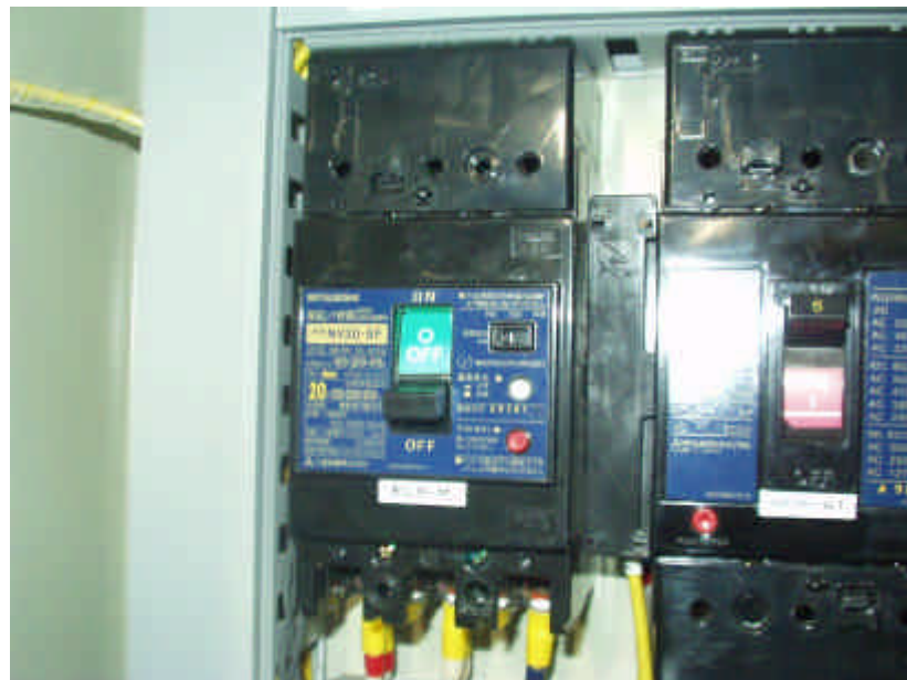
漏電ブレーカー（制御盤内）