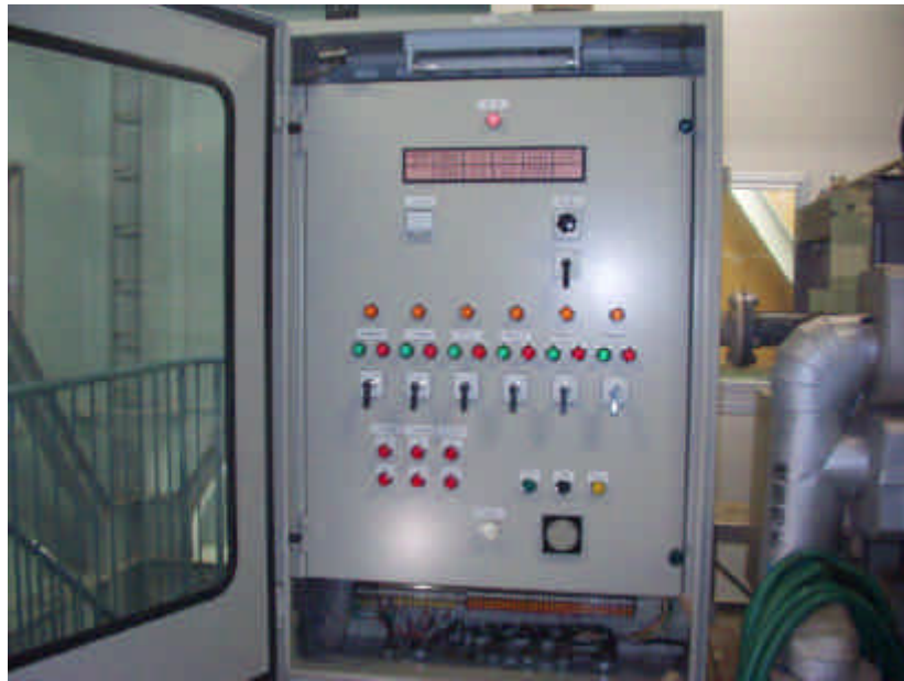
脱水機操作制御盤全景