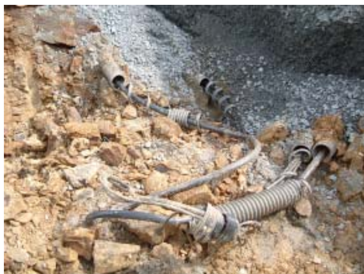
光ケーブル等切断箇所