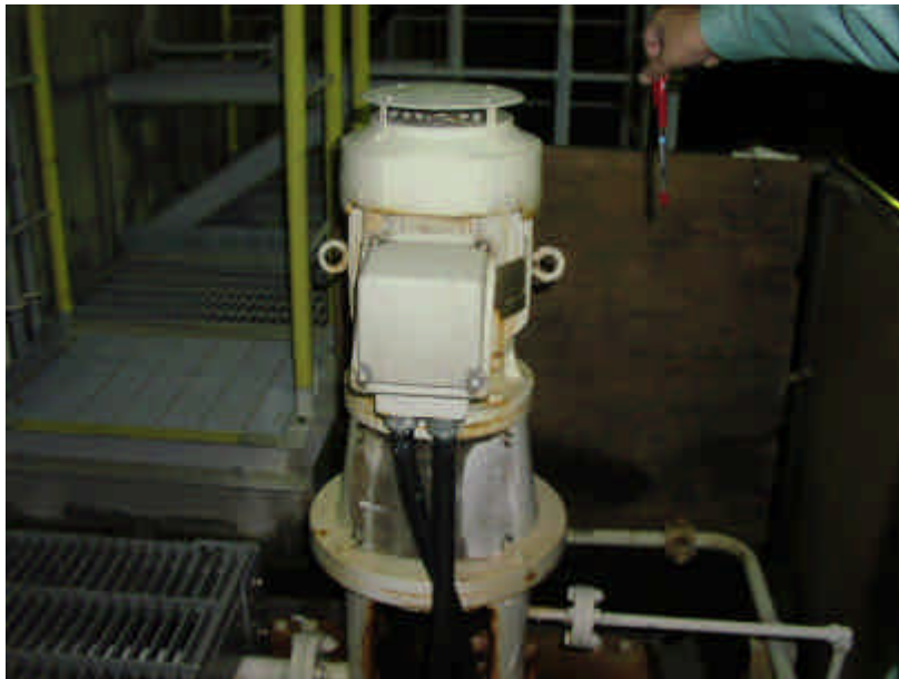
試料採取用ポンプ 3 B (異常なし)