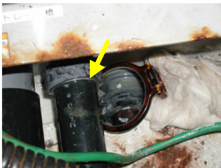
配管継手部拡大図