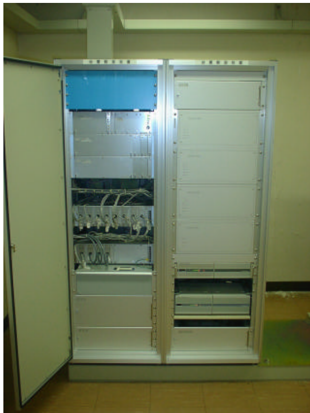
観測用地震計（測定部）