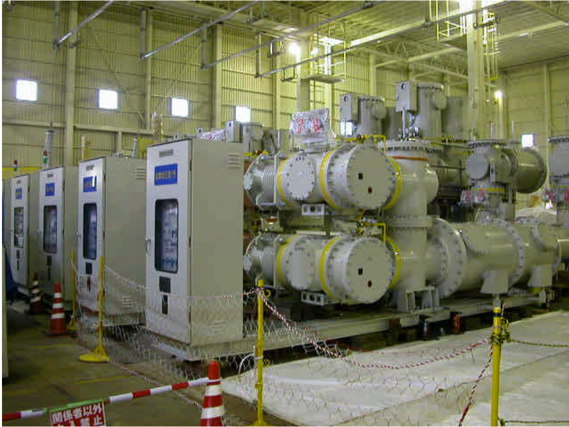
G I S (ガス絶縁開閉装置)