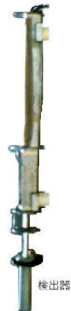
伊方1, 2号機放水口水モニタ設置状況