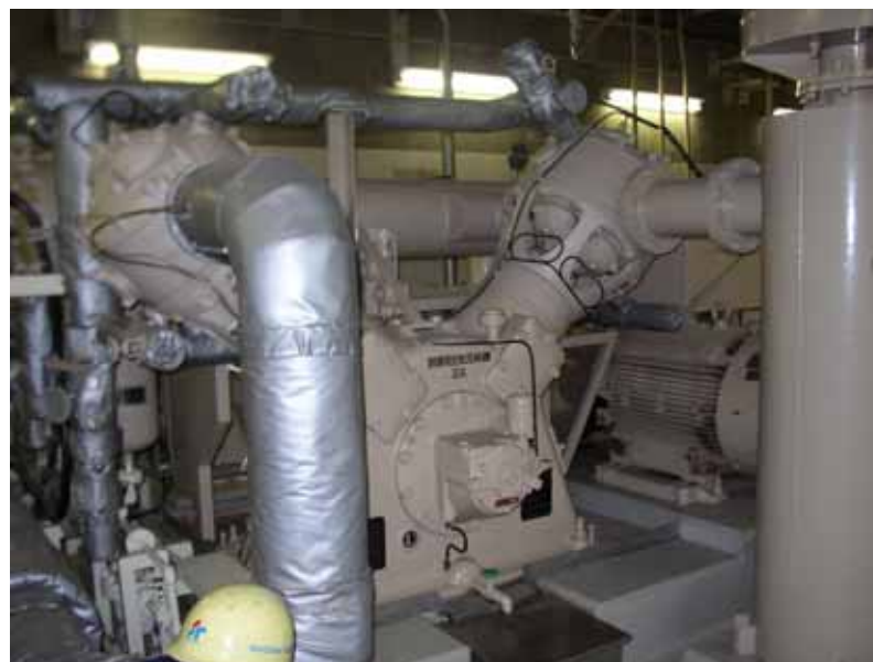
制御用空気圧縮機