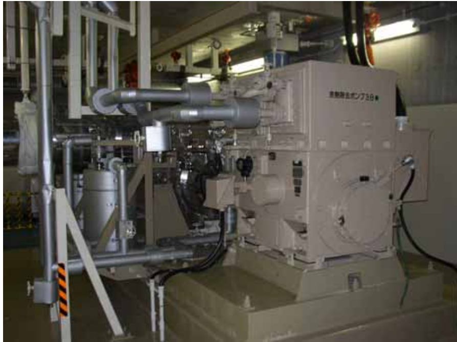
余熱除去ポンプ全景