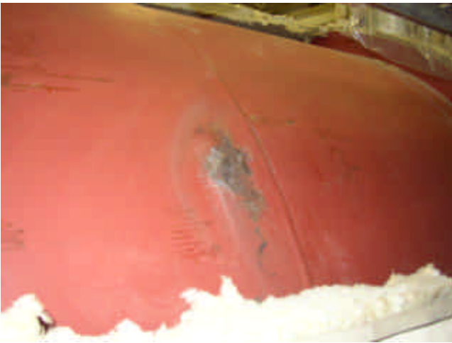
漏えい箇所(保温材取外時)