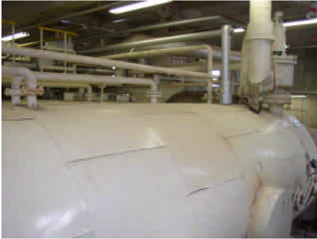
海水淡水化装置蒸発器