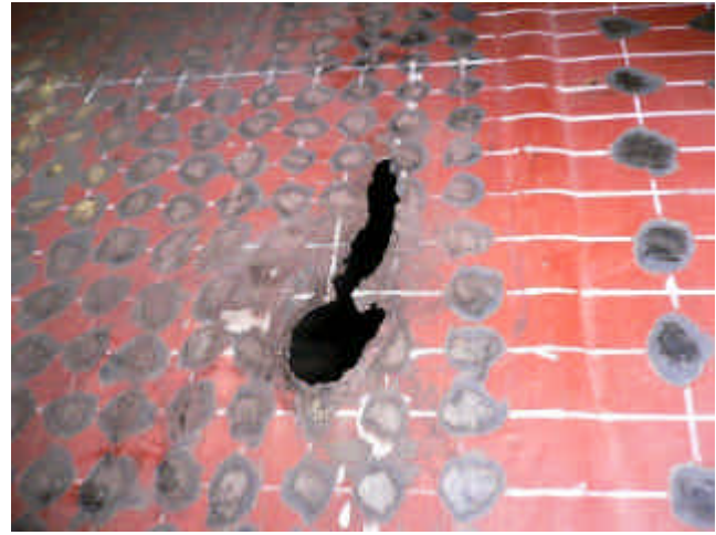
漏えい箇所(手入れ後) (貫通部：約40mm×約100mm)