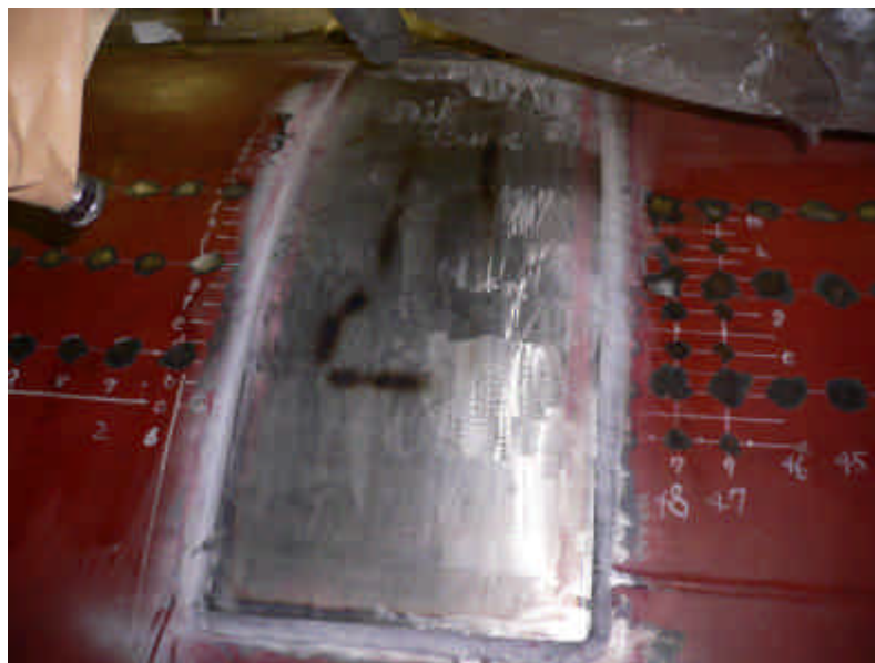
補修後 (当て板仕様：横300mm×縦760mm×厚さ12mm 材質：炭素鋼)