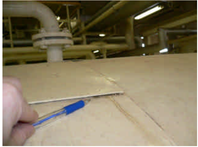
漏えい状況 (漏えい量推計：約3リットル)