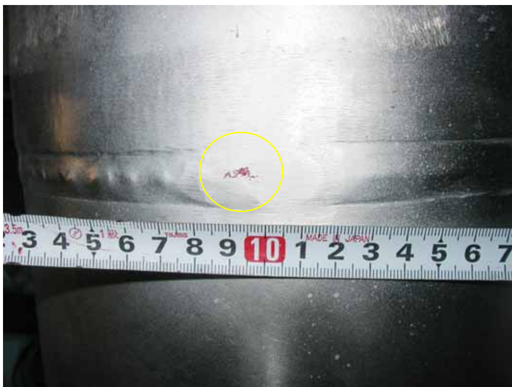
液体浸透探傷検査状況