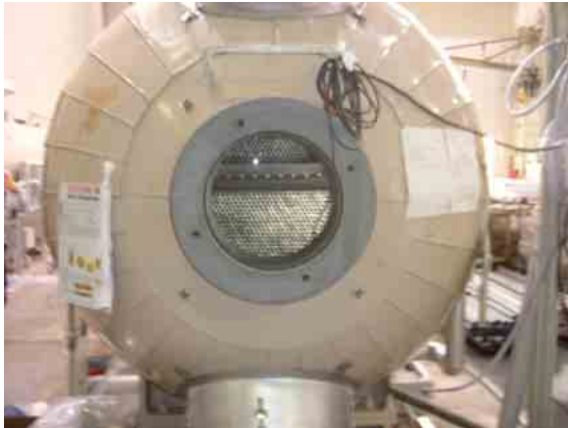
第5 高圧給水加熱器