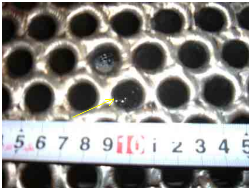
管板部拡大写真(漏えい箇所周辺)