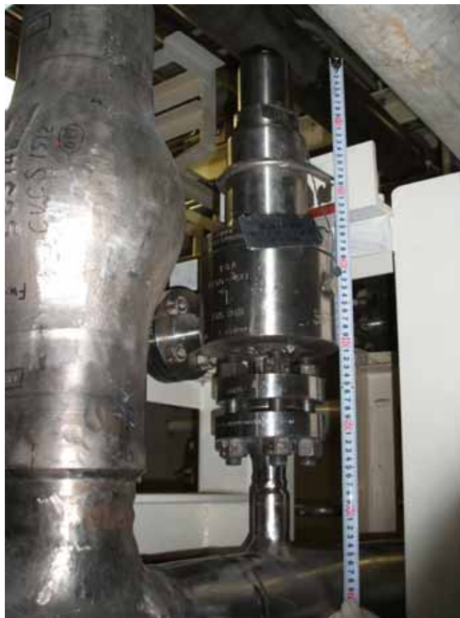
充てんポンプ逃し弁