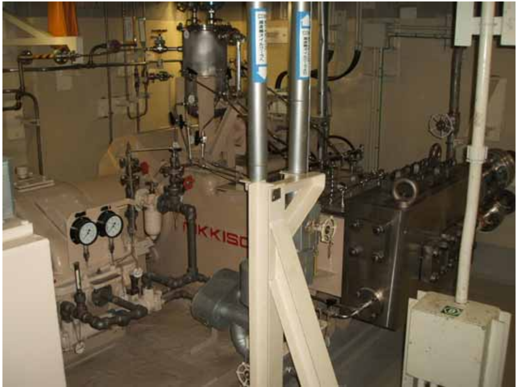
充てんポンプ全景