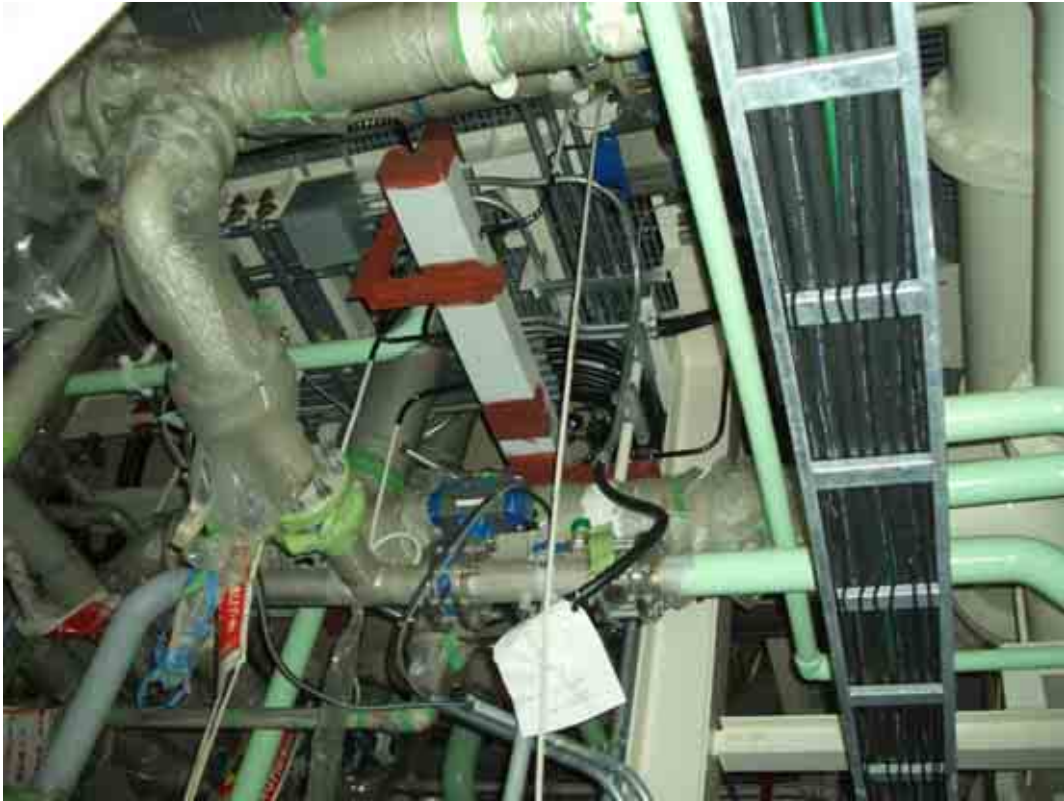
作業現場 (上部フロアを見上げた状況)