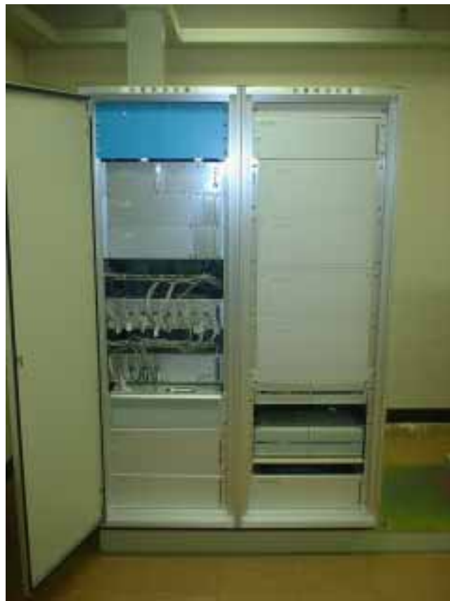
観測用地震計（測定部）