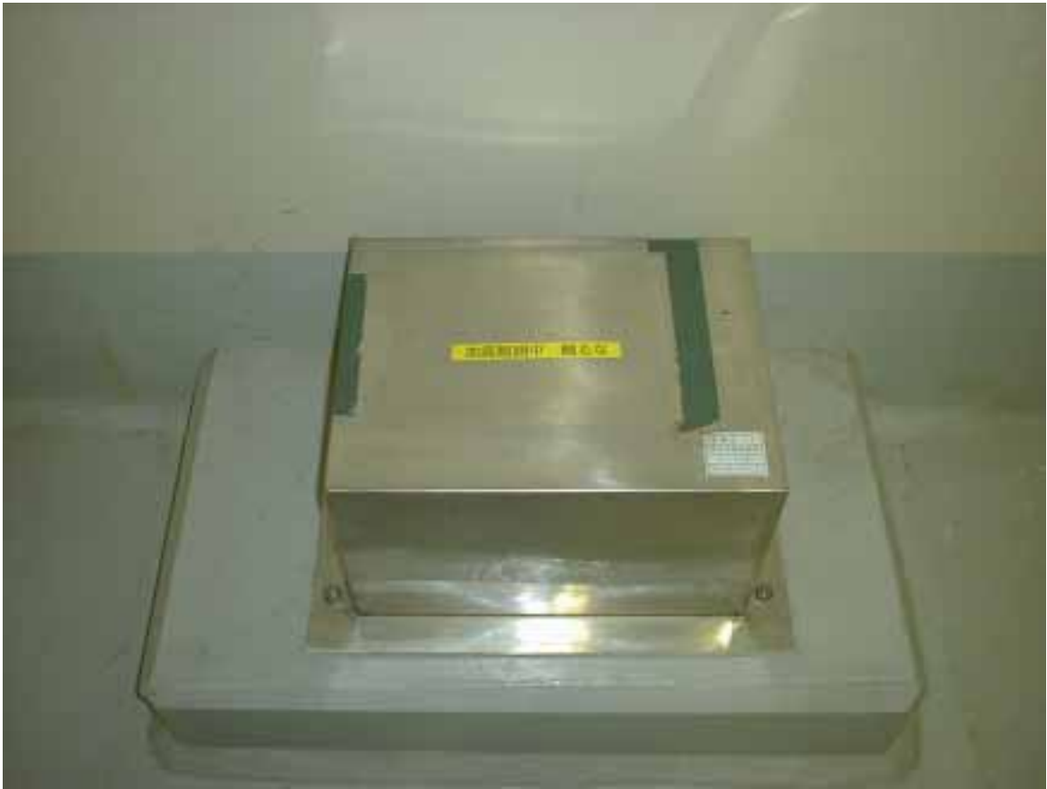
観測用地震計（検出部）