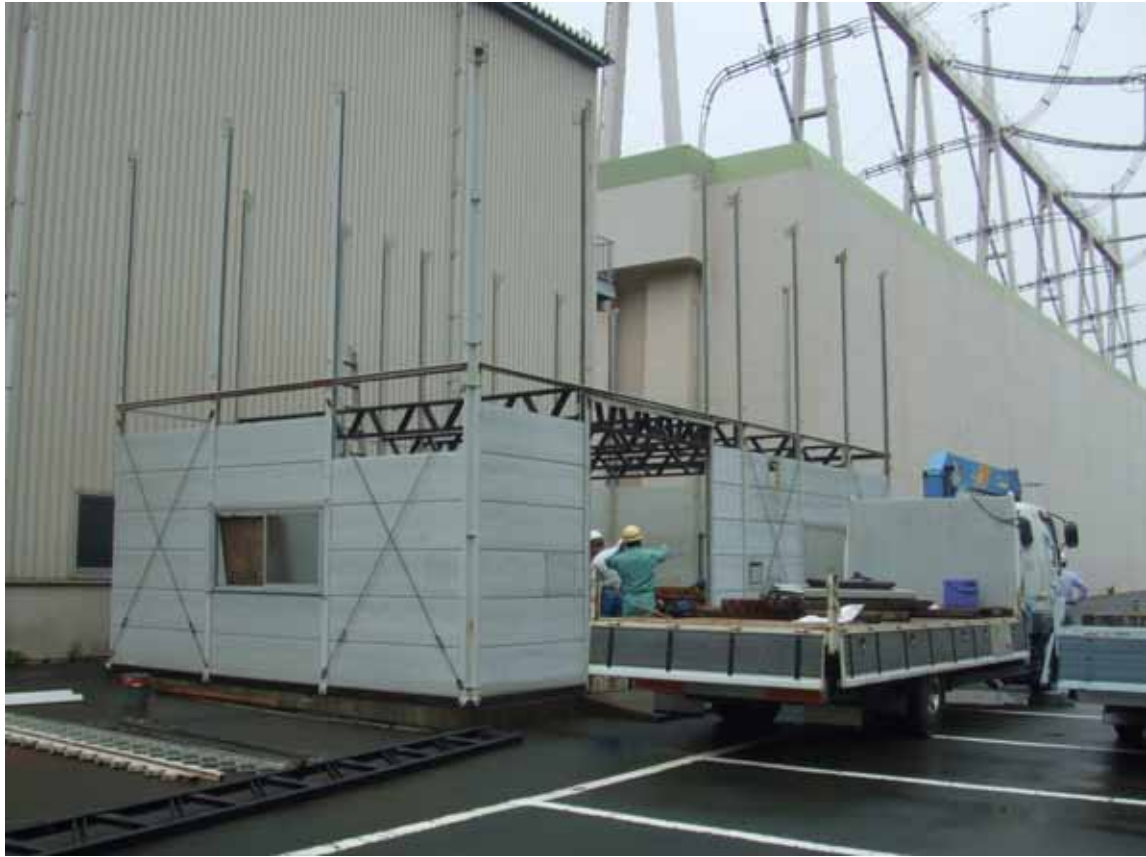
仮設プレハブ小屋写真（2階部分解体済。）