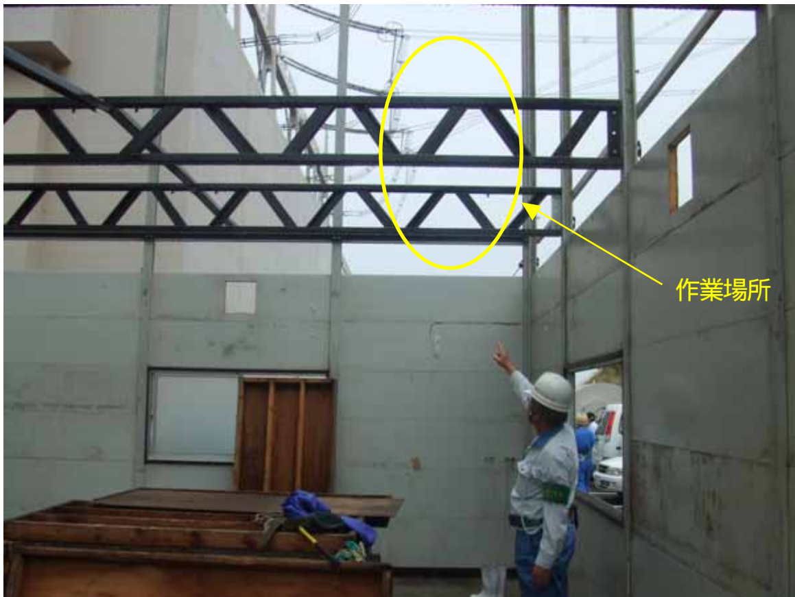
仮設プレハブ小屋内部写真