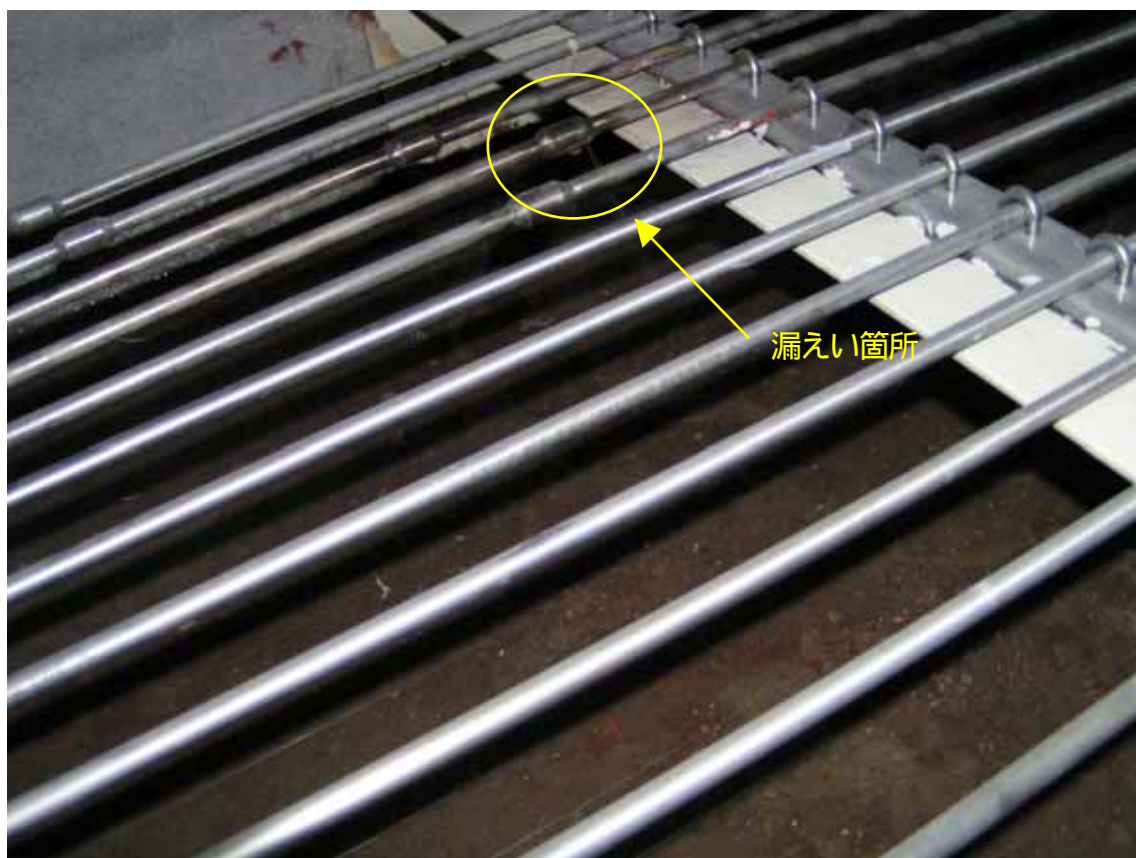
配管からの漏えい箇所