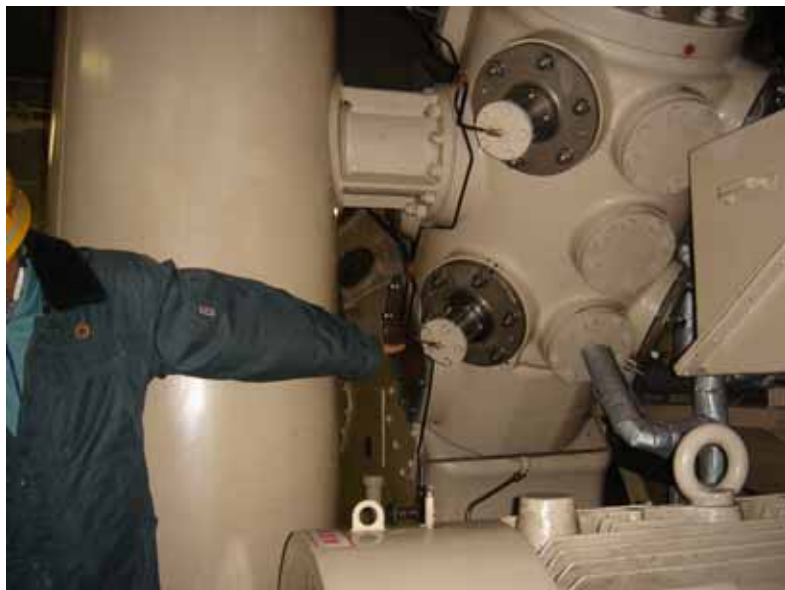
制御用空気圧縮機