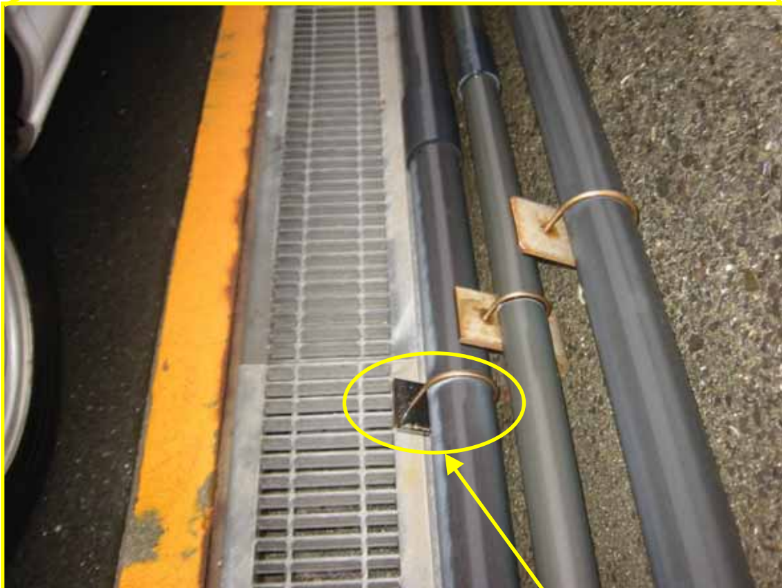
接触箇所拡大写真