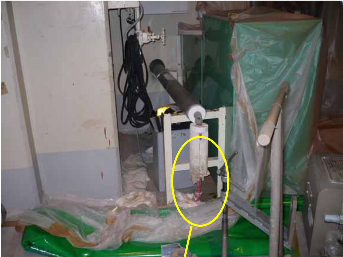
補助蒸気戻り配管