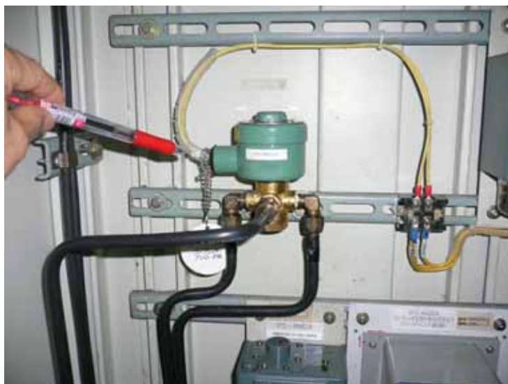
制御用空気圧縮機制御回路 電磁弁