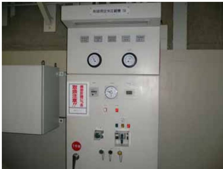
制御用空気圧縮機 1 A 現場制御盤