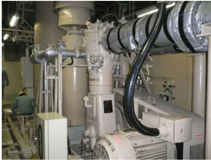
制御用空気圧縮機 1 A