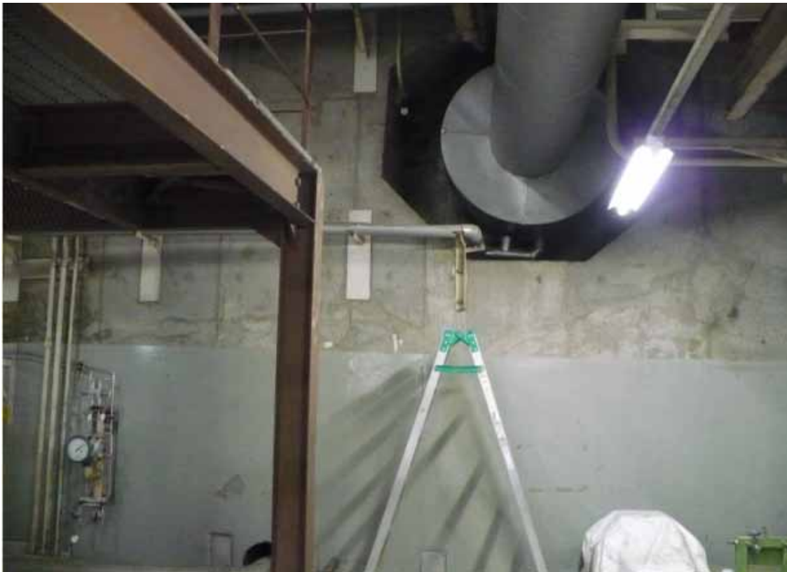
主給水配管（格納容器外側から格納容器外周コンクリート壁を見た写真）