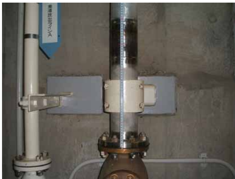
湧水排水配管 (復旧後)