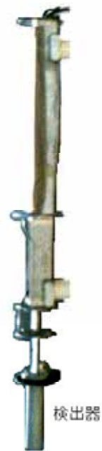
伊方1, 2号機放水口水モニタ設置状況