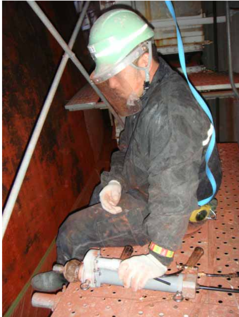
外面塗装下地処理現場の様子（再現）