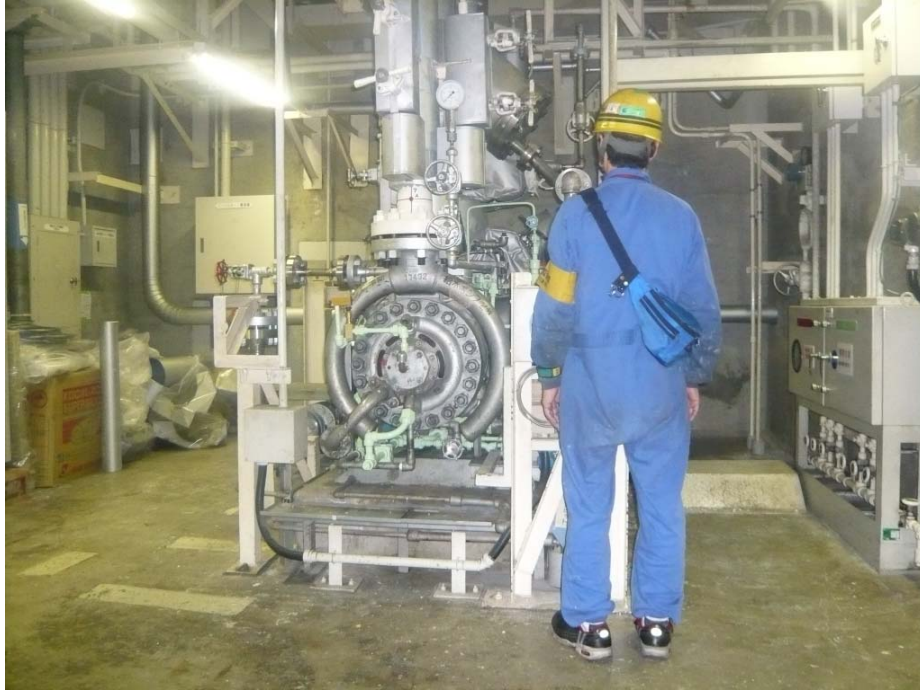
タービン動補助給水ポンプ