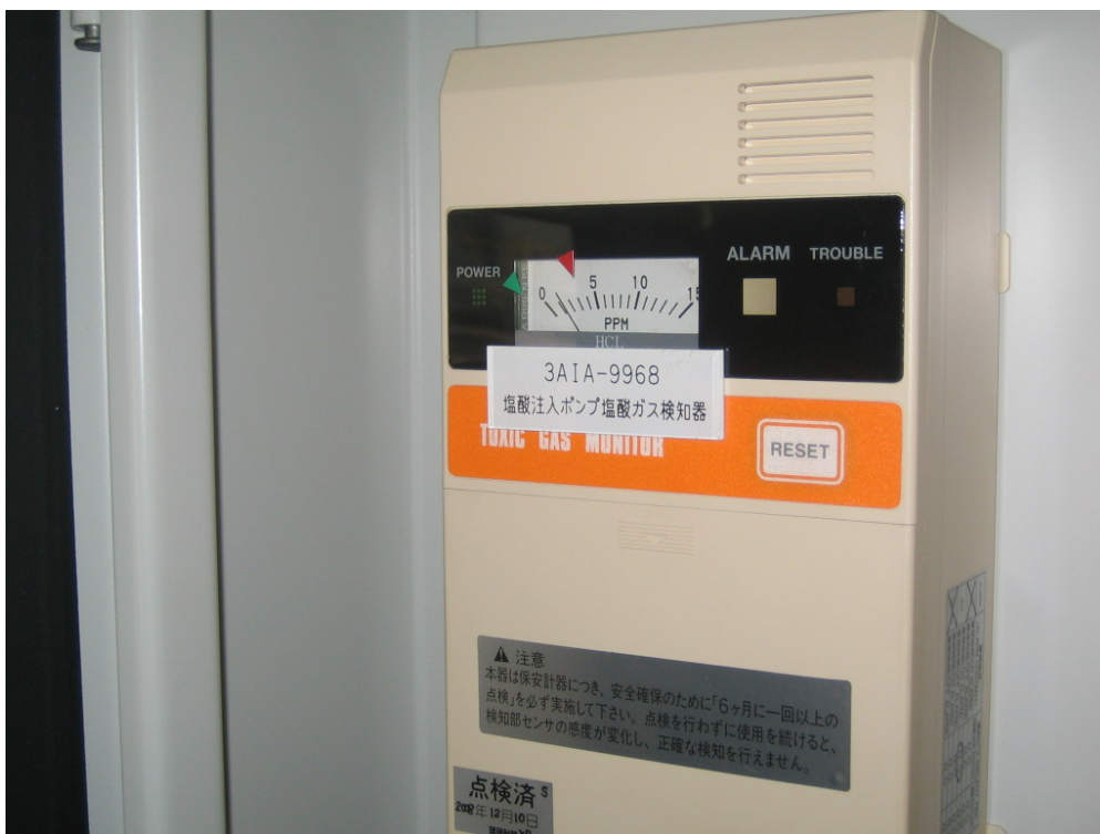
塩酸注入ポンプ塩酸ガス検知器（2 ppm）