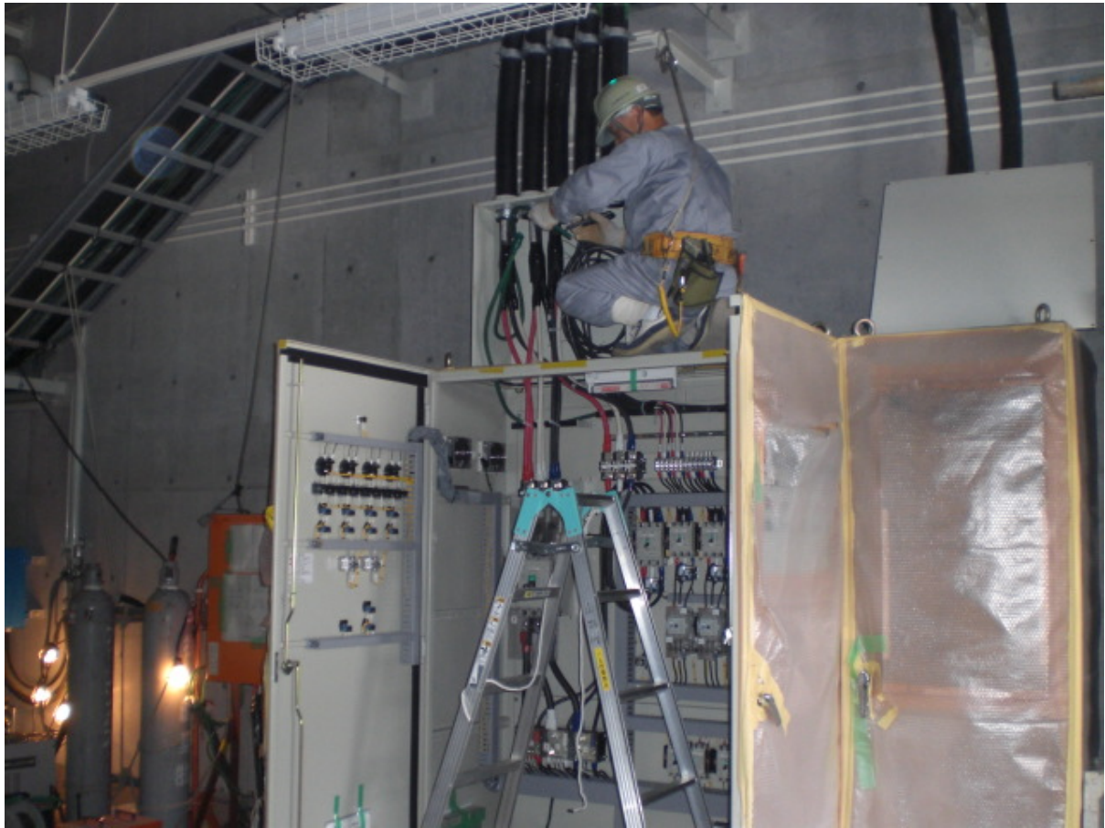
作業現場の状況（雑固体処理建屋）