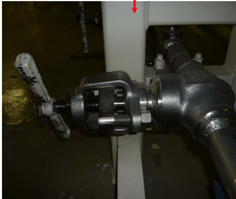
充てんラインのミニマムフロー弁