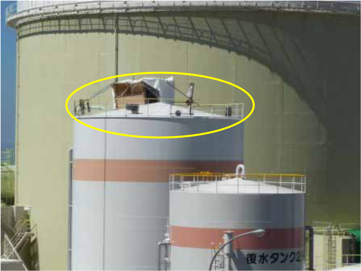
燃料取替用水タンク（上部で作業）