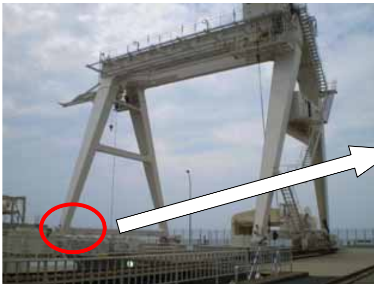
1・2号機取水口クレーン全景