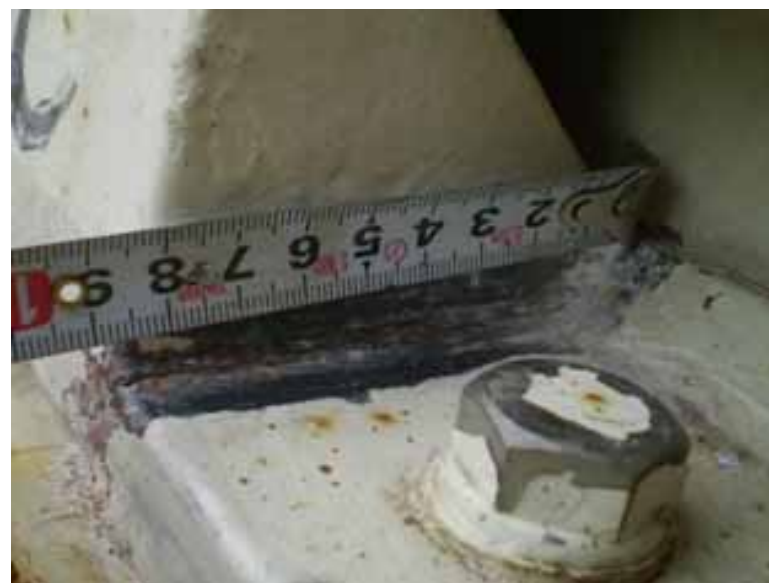
走行用電動機脚部ひび割れ状況