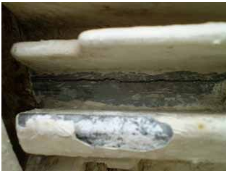
走行用電動機フィン部ひび割れ状況