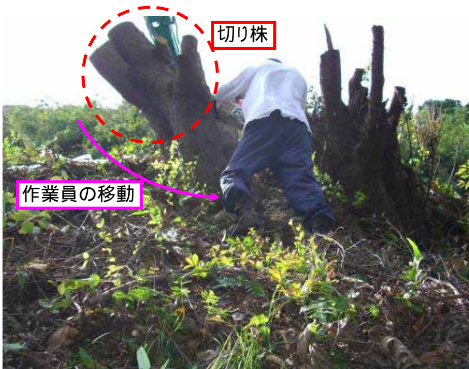
伐採状況再現写真(斜面下部より撮影)

切り株の切断が終わり、撤去のためワイヤーで吊り上げていたところ、切断が不十分な部分があったため切断するために斜面を移動し作業を始めようとしたところ、足を滑らせて左腕をチェーンソーで負傷した。