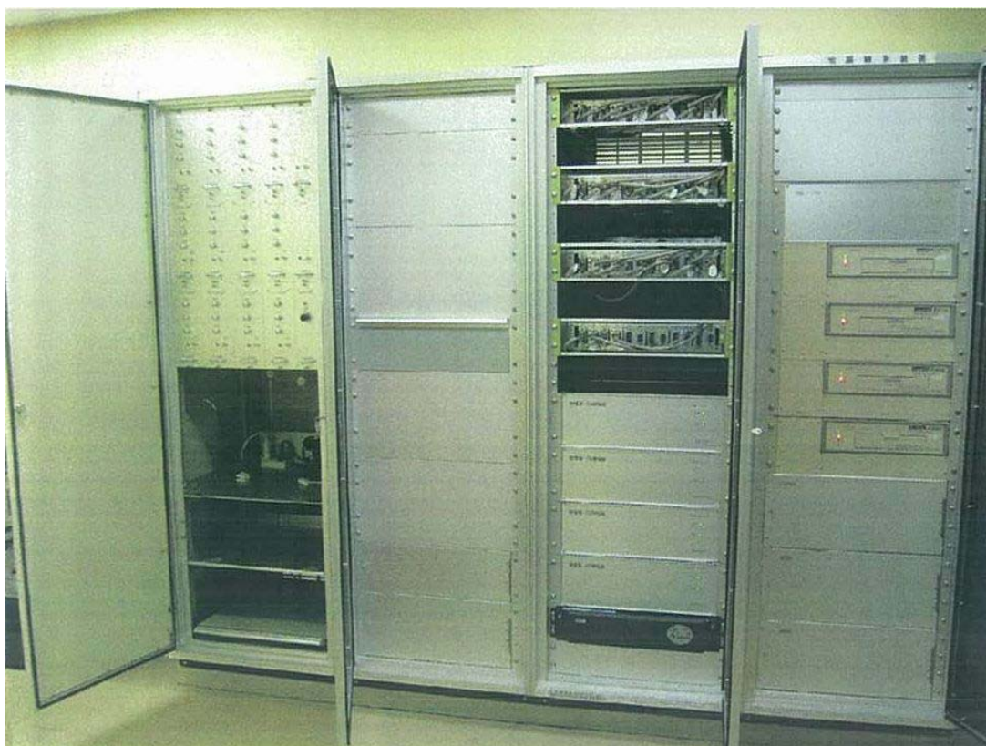
観測用地震計（測定部）