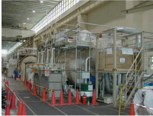
湿分分離加熱器全景