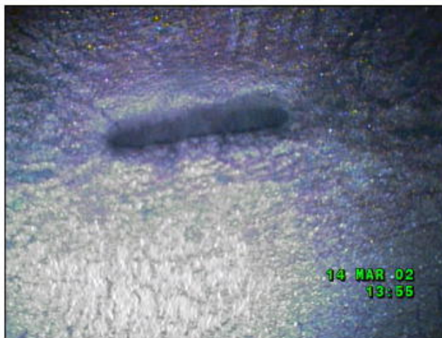
伝熱管内部（漏えい箇所のファイバースコープ写真）