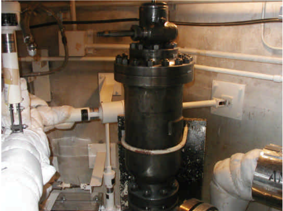
加压器安全弁全景