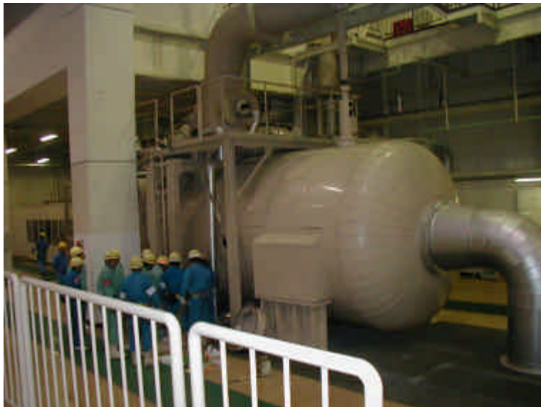
湿分分離加熱器（全景）