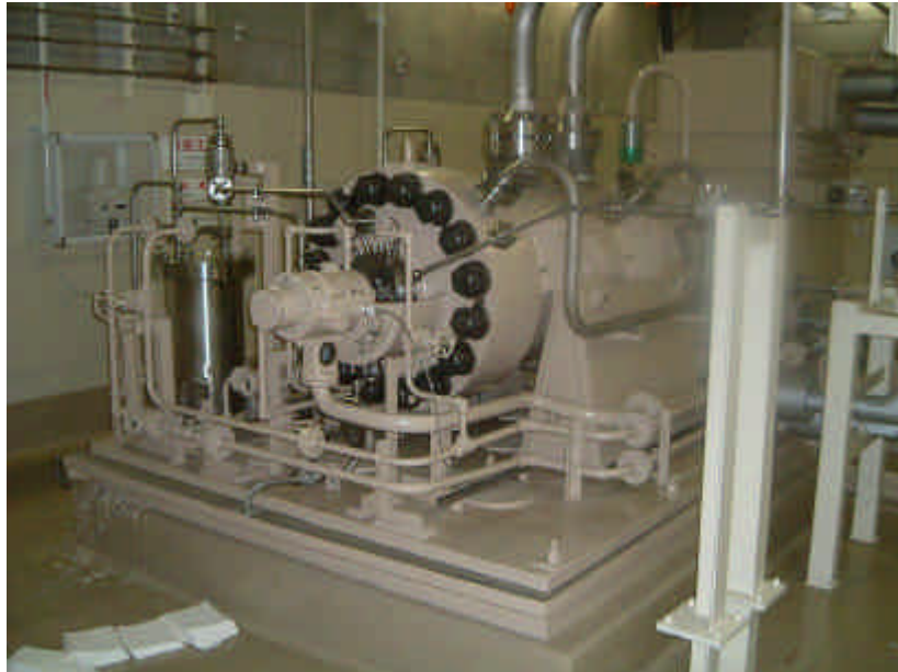
充てんポンプC号機全景