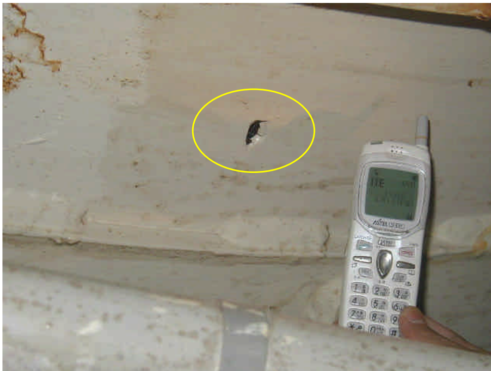
穴あき箇所（約 1cm x 2cm）