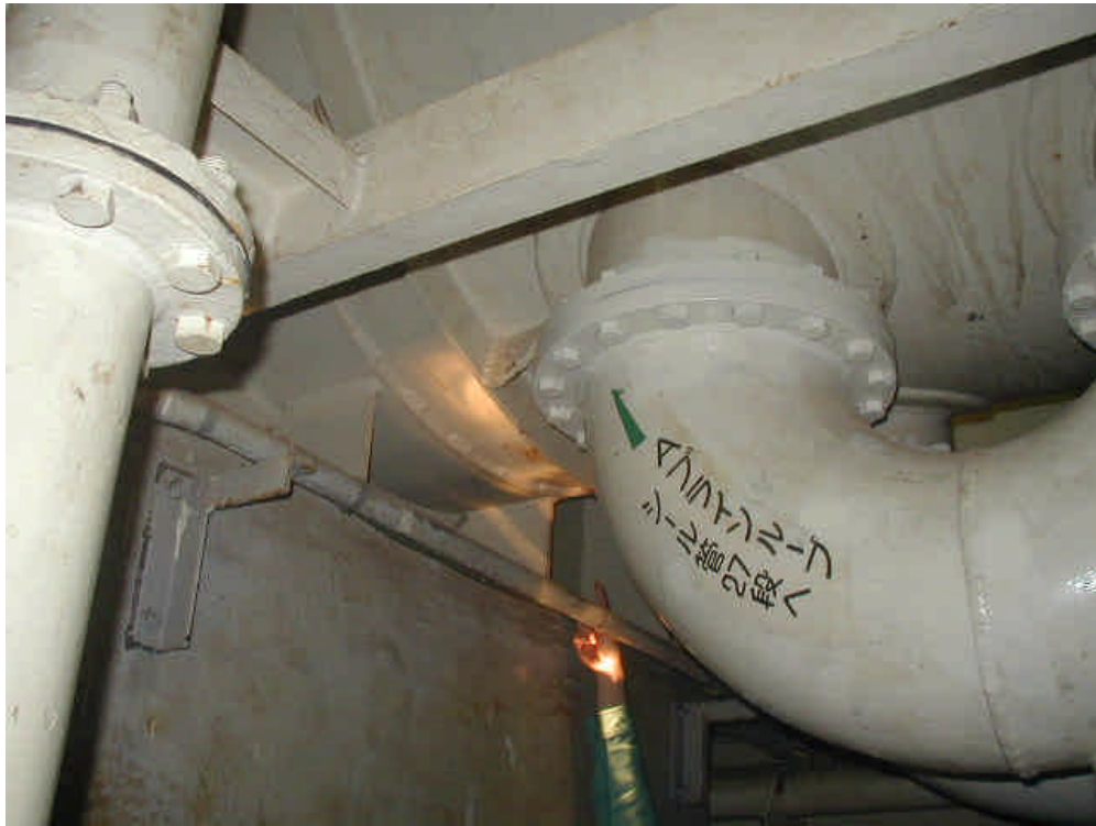
海水淡水化装置下部（穴あき箇所付近）