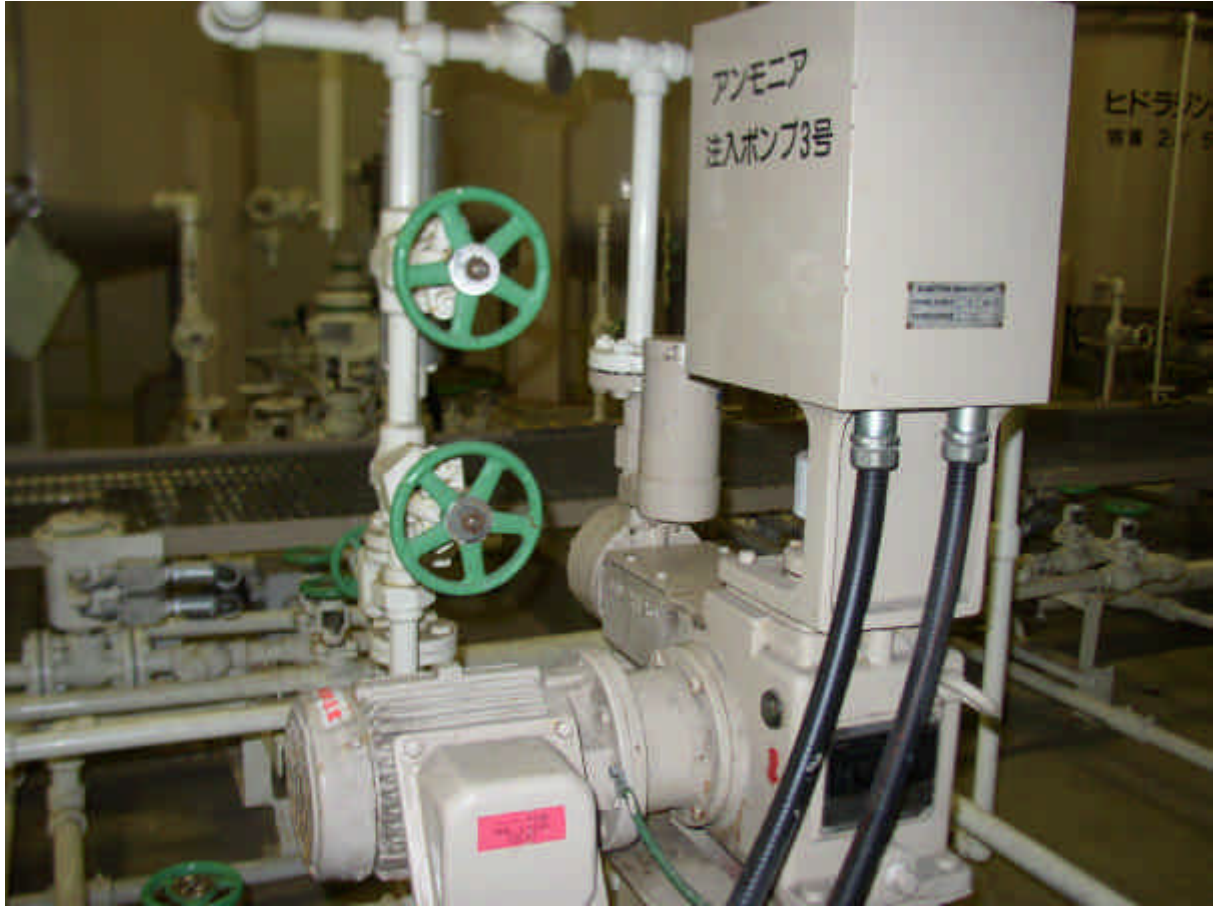
アンモニア注入ポンプ全景