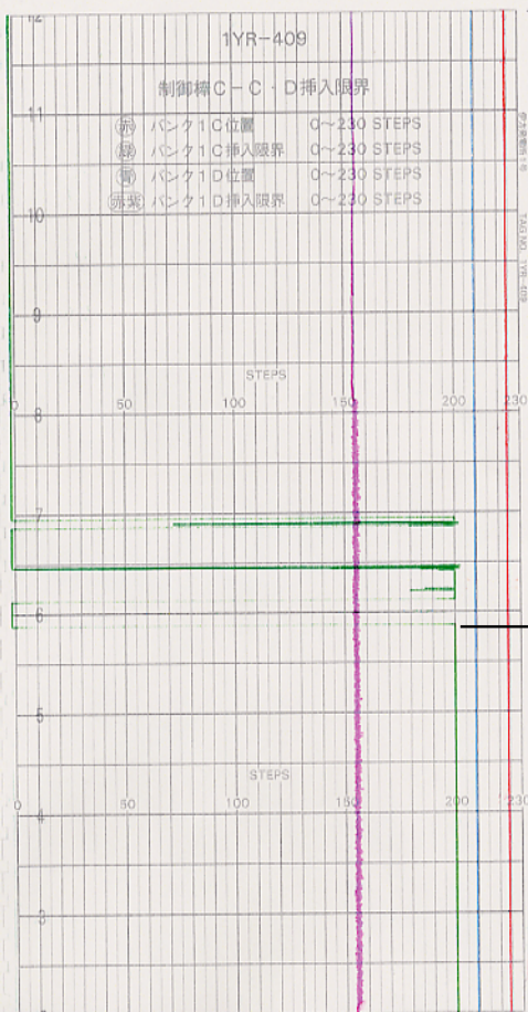
制御棒挿入限界記録計チャート