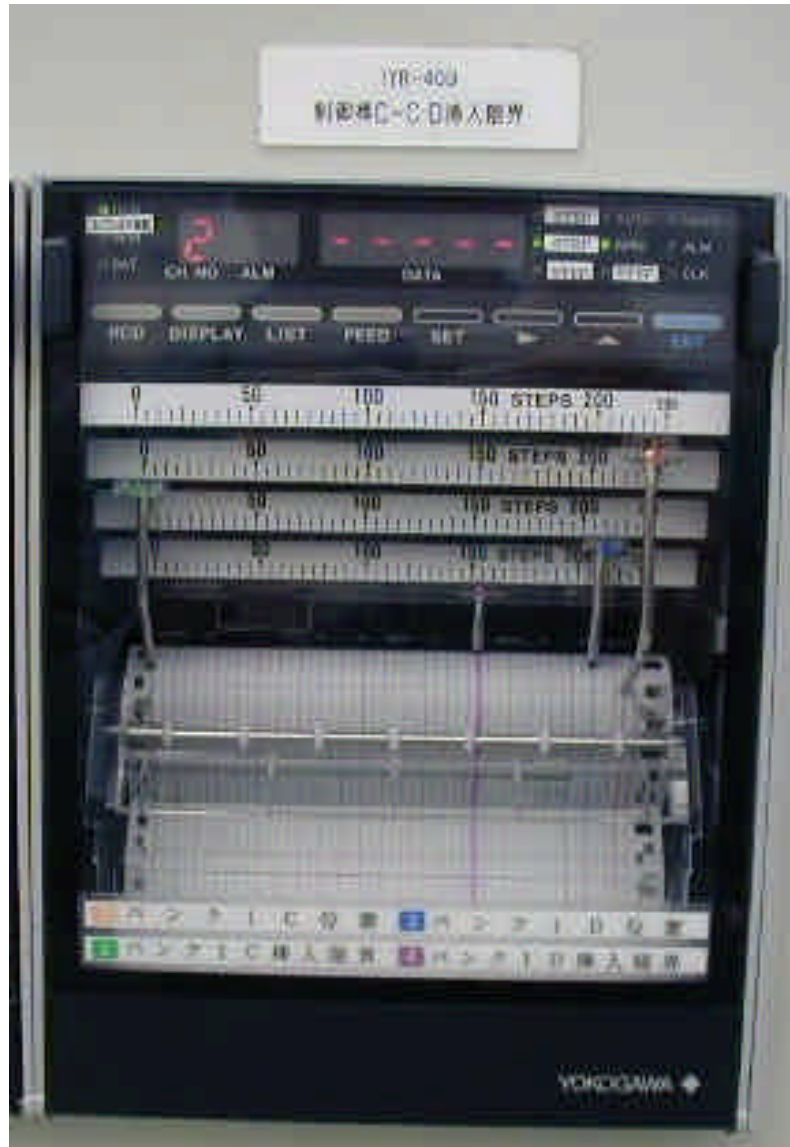
制御棒挿入限界記録計