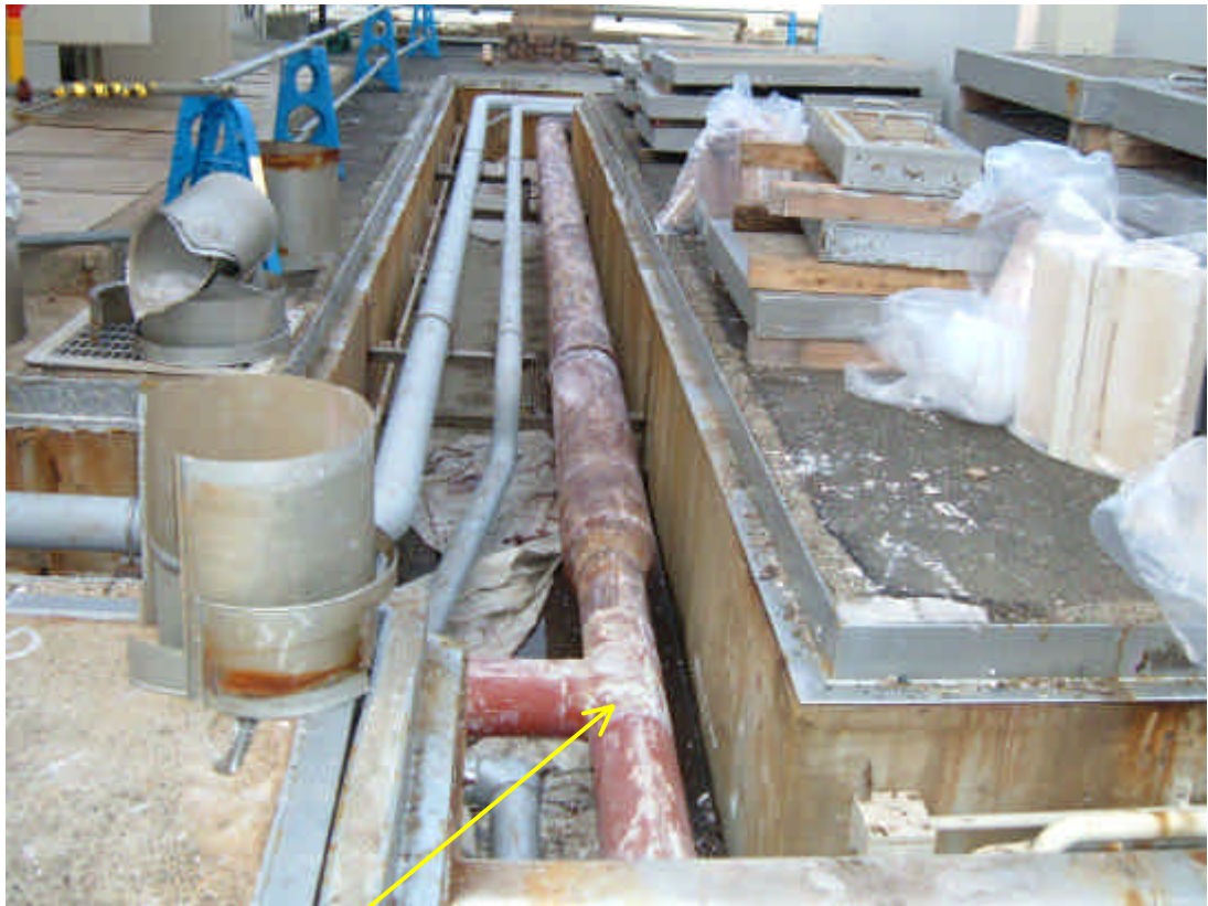
脱気器建屋ダクト部