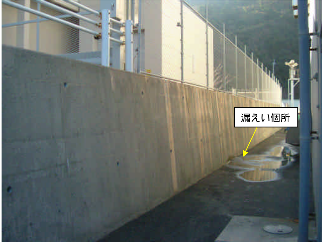
消火用水漏えい現場