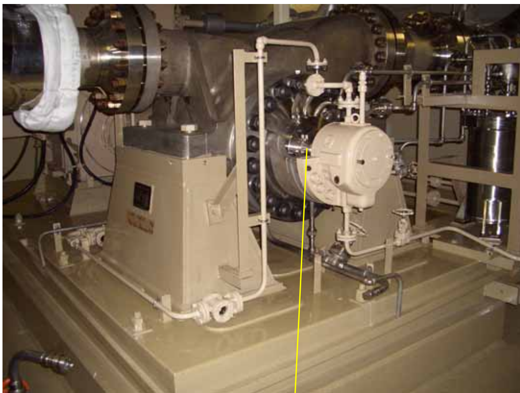
余熱除去ポンプ全景