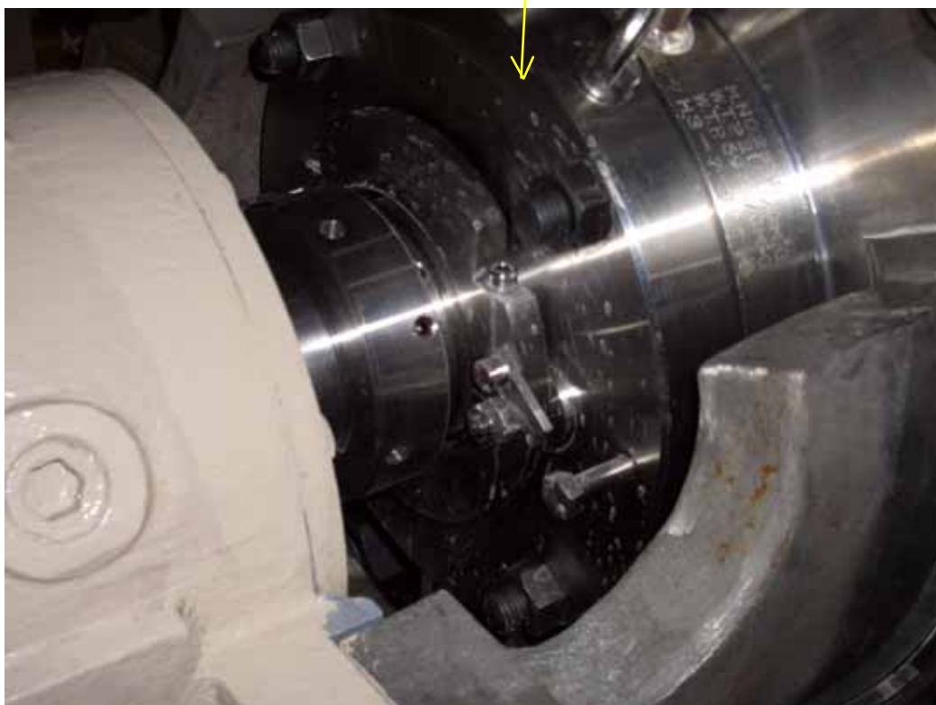
余熱除去ポンプメカニカルシール部