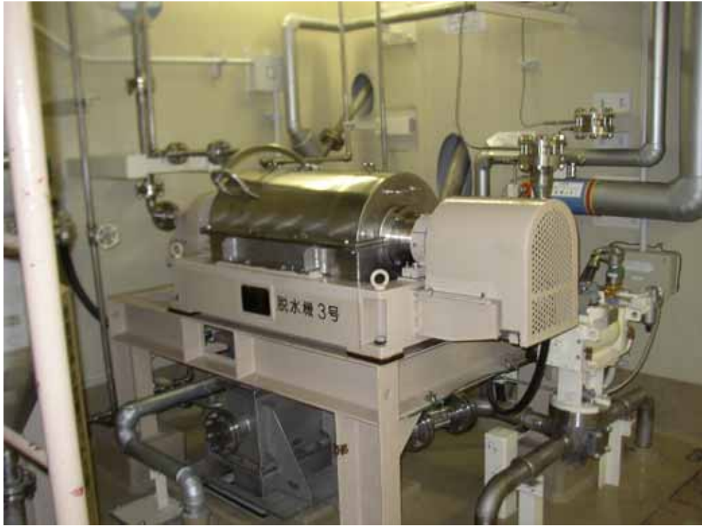
セメント固化装置脱水機全景