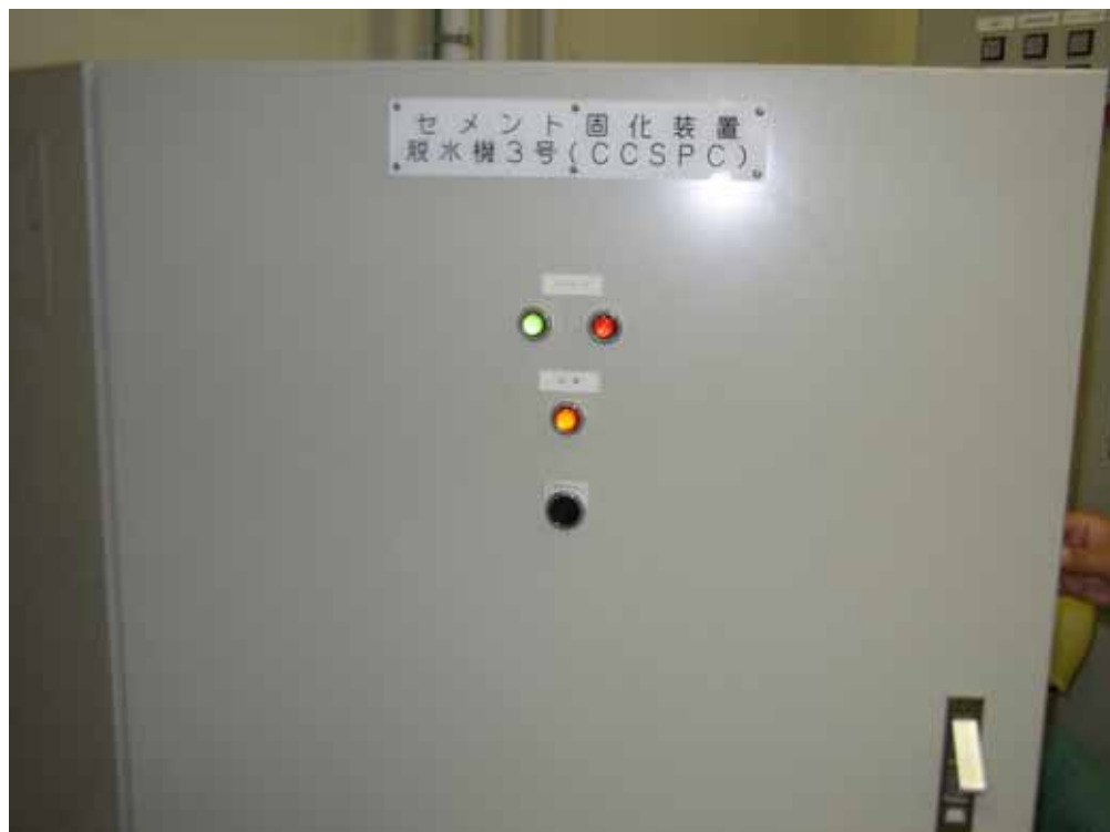
インバータ盤全景