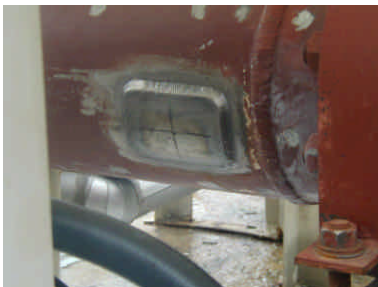
補修後 (当て板仕様：横 100mm×縦 70mm×厚さ 6mm 材質：炭素鋼)