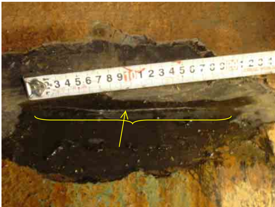
割れ部拡大写真 (割れ部：約20cm)