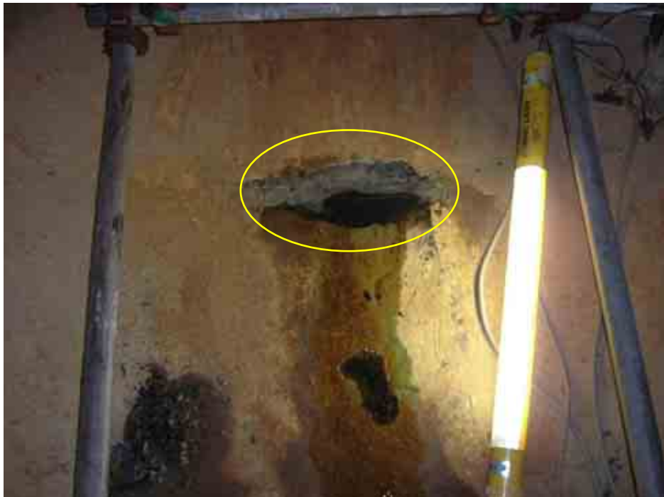
放水管内部(底面)割れ箇所