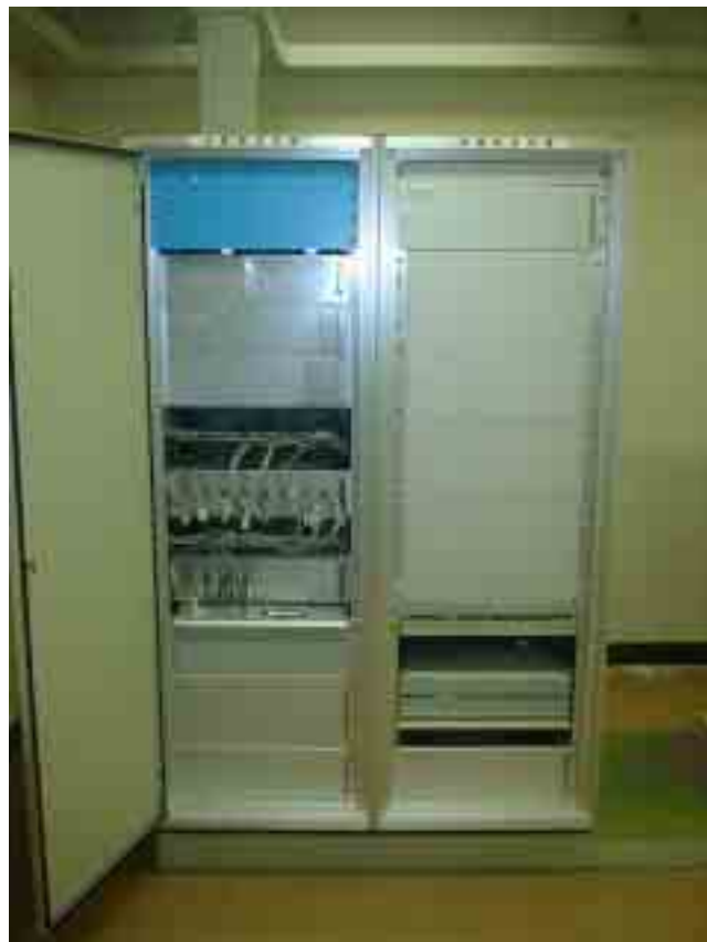
観測用地震計（測定部）