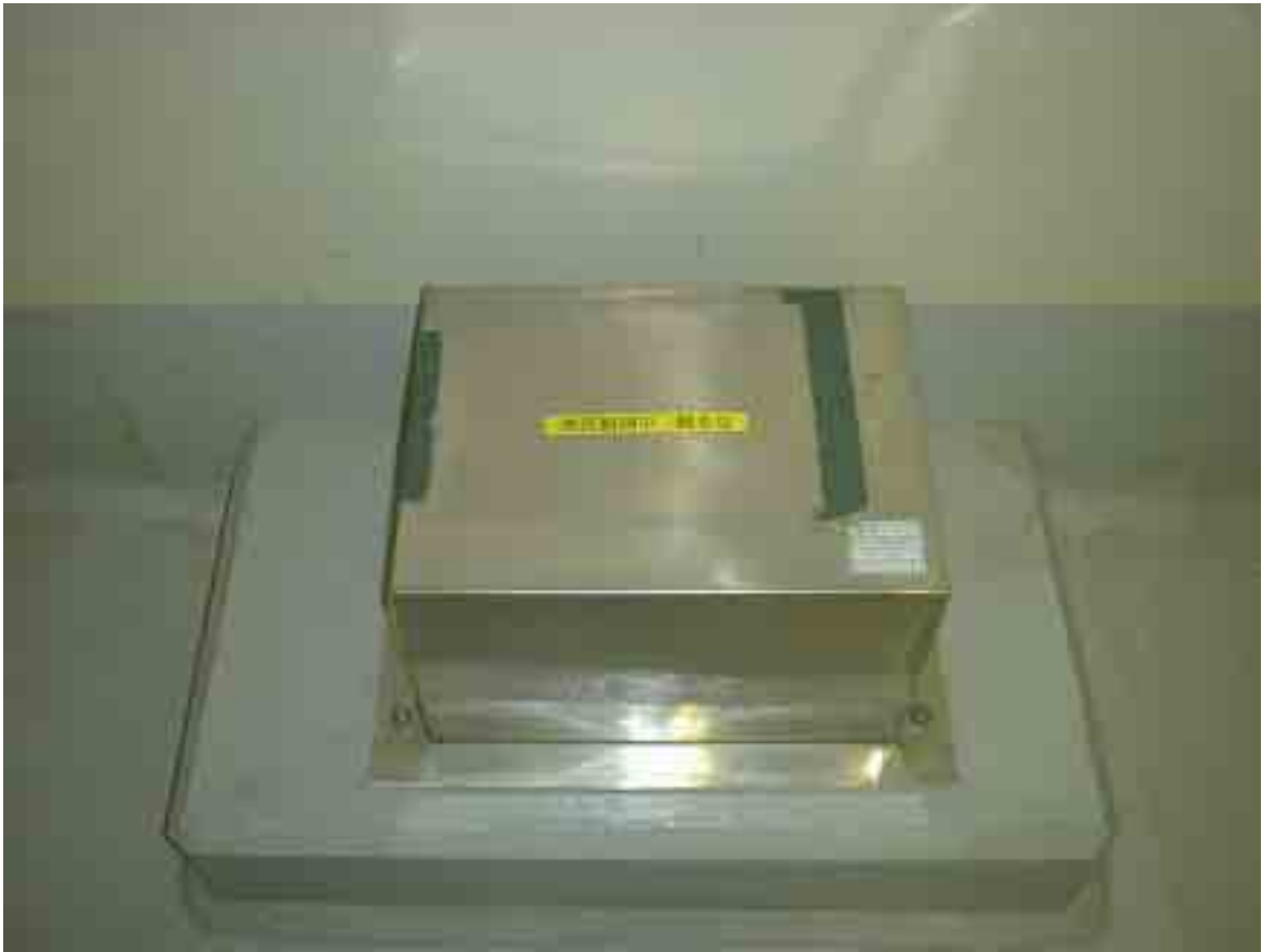
観測用地震計（検出部）