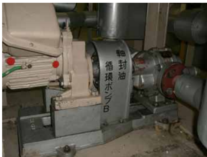
軸封油循環ポンプB写真