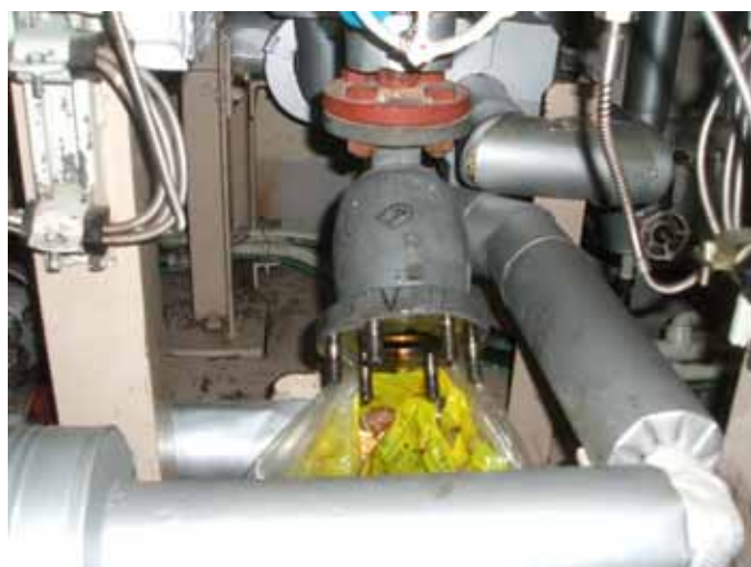
ストレーナ分解写真