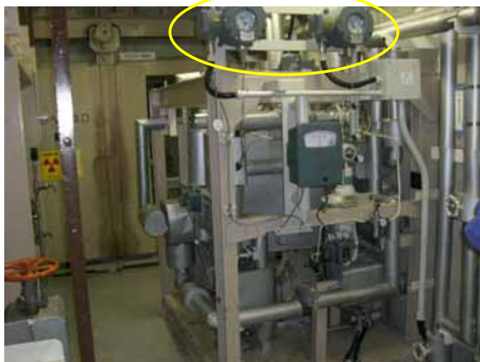
軸封油圧力計写真