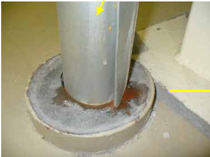
補助蒸気ドレン配管拡大