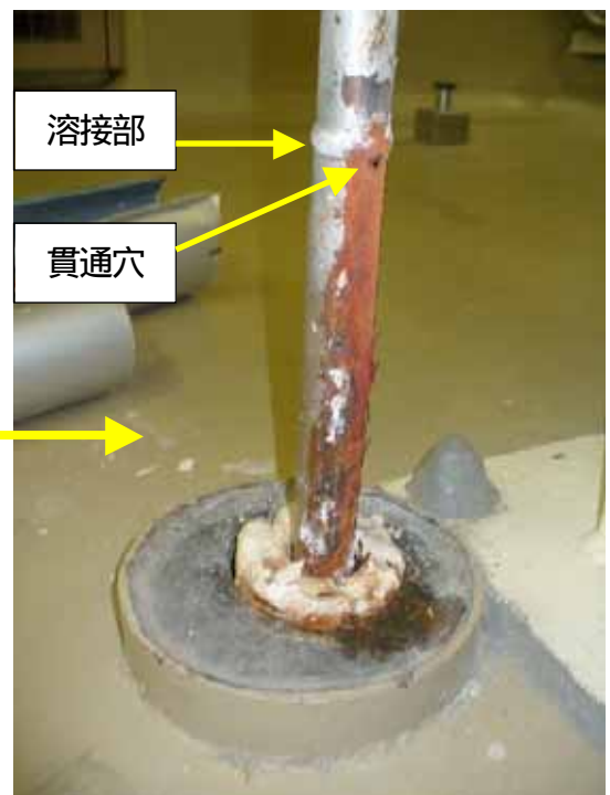
保温材をはずした配管