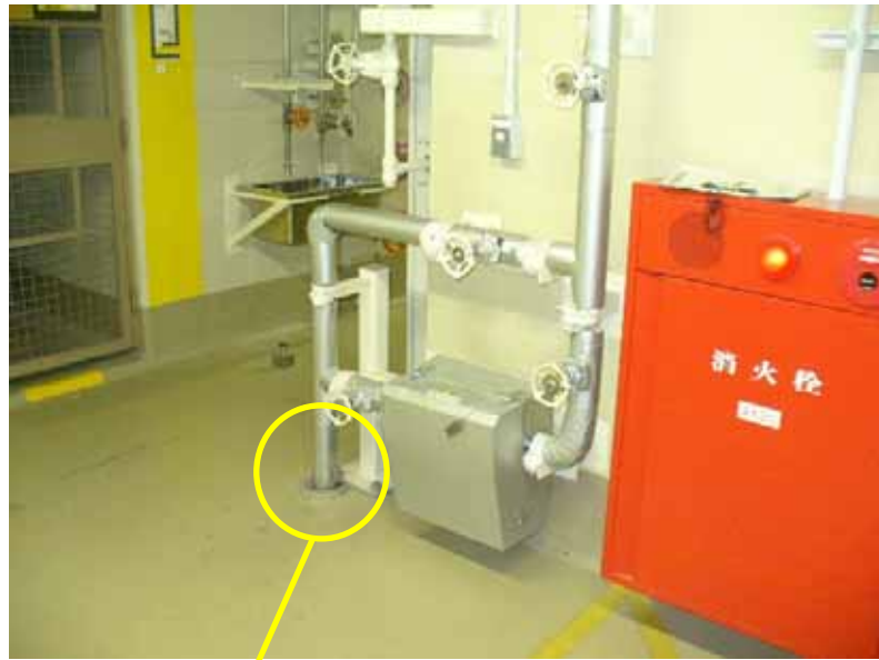
補助蒸気ドレン配管